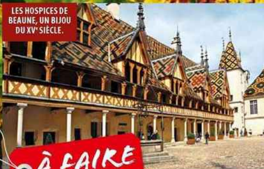
LES HOSPICES DE BEAUNE, UN BIJOU DU XV e SIÈCLE.