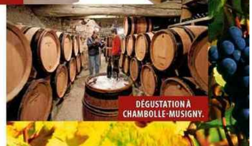
DÉGUSTATION À CHAMBOLLE-MUSIGNY.

da7a55ae600810082a240d4130c25972919837db146501